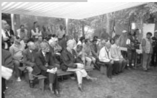
Ca' Malanca - 25 luglio 2004 In prima fila, sulla sinistra l'On. Gabriele Albonetti. A dx, in prima fila i Comandanti Amato e Tito del 36ª btg. Garibaldi e partecipanti alla Battaglia di Purocielo.

L'edificio di Ca' Malanca è stato costruito nell'Ottocento ed è situato a 721 metri di altezza sul livello del mare. Collocata poco più sotto del crinale che si estende dal Sintria al Lamone, Ca' Malanca consente tra l'altro di osservare uno dei panorami più ampi e interessanti dell'Appennino. La casa è stata fatta secondo la tipologia collinare ed è stata ristrutturata di recente con la dotazione di tutte le strutture necessarie per ospitare gruppi e comitive, la realizzazione di un impianto di luce