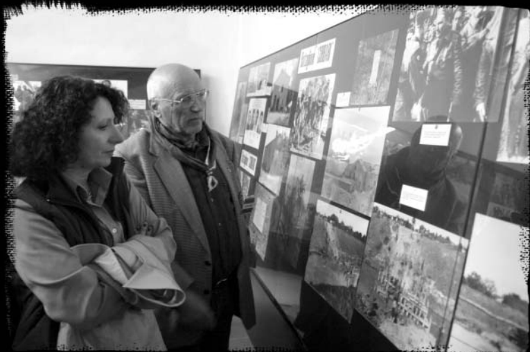
Il Museo di Cà Malanca